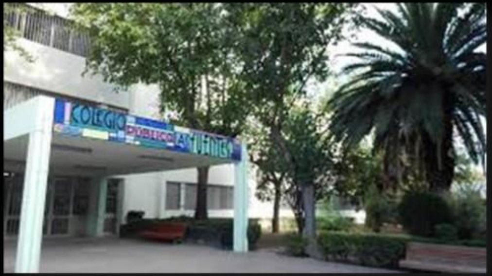
CEIP LAS FUENTES